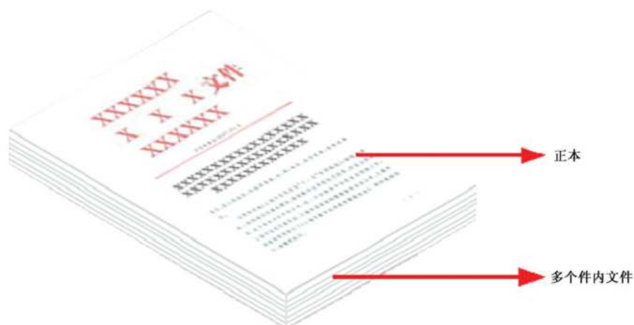
图 E.1 电子档案表现形式示意图

以发文为例,包含多个件内文件(正本、文件处理单、定稿、历次修改稿等)的电子档案可合并成一个 OFD 文件,其呈现形式,见图 E.1。